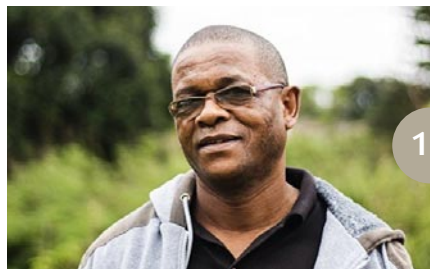
LYDIE Association Burkina Faso